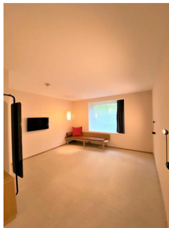
Beispielzimmer unmöbliert (Diese Objekte bleiben im Raum)