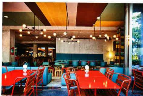
Dans «l'Eatery» – la salle à manger – on se retrouve en toute simplicité pour manger. En soirée, on se rencontre au bar pour un dernier verre.